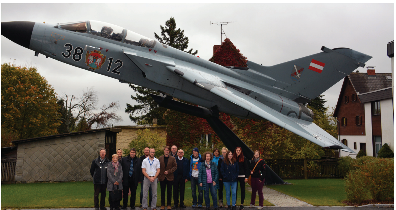
Besuch bei Fa. Testfuchs

Der 26. November 2016 stand ganz im Zeichen des Absolventenvereins. Am frühen Nachmittag fand die Jahreshauptversammlung in Räumlichkeiten des Gymnasiums statt. Im Rahmen dieser Sitzung wurde die finanzielle Unterstützung von zwei Projekten an der Schule beschlossen: zum einen wurde eine zusätzliche Monitor für die Aula angekauft, um die Schülerinnen und Schüler mit Informationen immer auf dem Laufenden zu halten, zum anderen